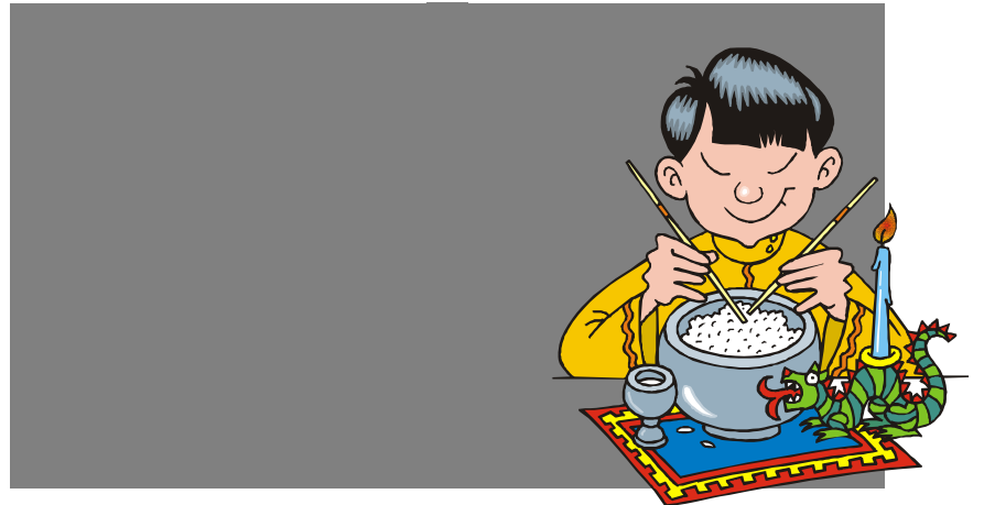
Der Kiebitz fragt: „Wann findet der erste Spatenstich für das TCM statt?“

Eine tote Stadt oder ein Museumsdorf nützen uns nichts.