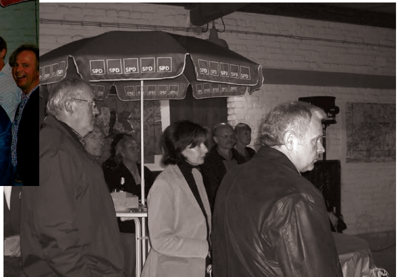
In Anwesenheit von Gästen wählte die SPD ihre Ratskandidaten